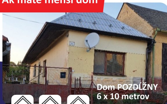
Dom POZDÍŽNY 6 x 10 metrov