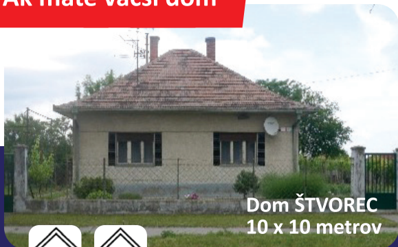
Dom ŠTVOREC 10 x 10 metrov